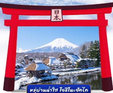
หมู่บ้านน้ำใส โอชิโนะซัคได