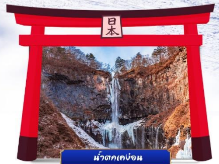
น้ำตกเคงอน