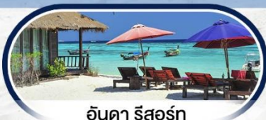
อินดา รีสอร์ท