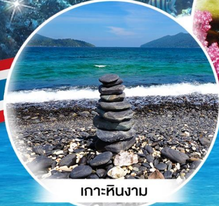
เกาะหินงาม