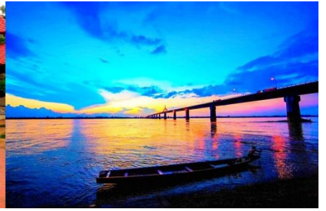
ที่พัก นำท่านเข้าสู่ที่พัก เวียงโขงมุกดาหาร (หรือเทียบเท่า)