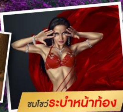
ชมโชว์ระบำหน้าท้อง