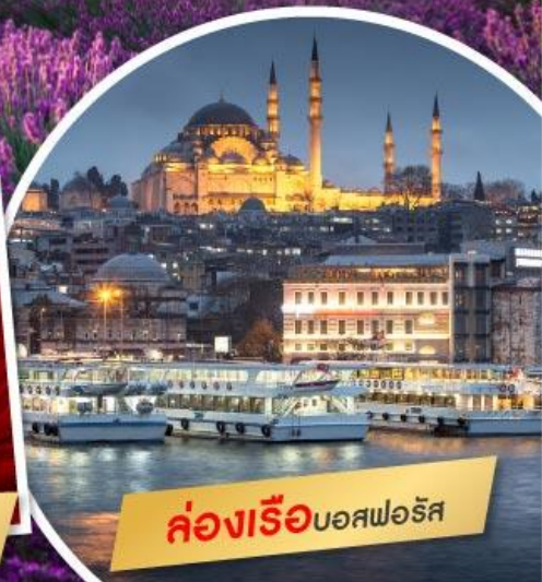
ล่องเรือบอสฟอรัส