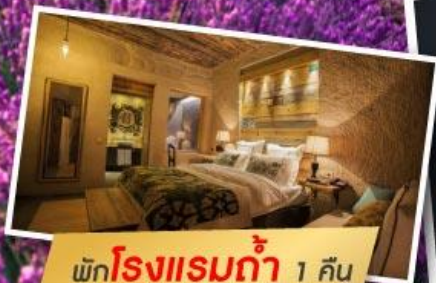
พักโรงแรมห้า 1 คืน