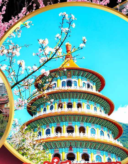
วัดอู่จีเทียนหยวน