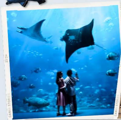
ZONE 7 : FAR FAR AWAY