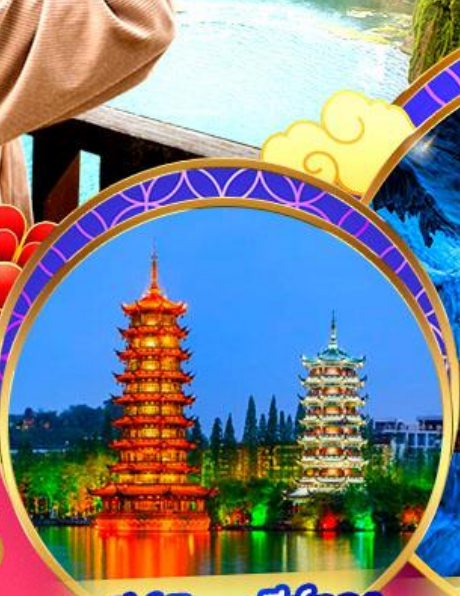
เจดีย์เงินเจดีย์ทอง