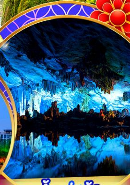
ถ้ำลุ่ยอ้อ

ดินแดนแห่งสายน้ำและภูเขาที่สวยงาม ส่องแม่น้ำหลีเจียงครึ่งสาย หมู่บ้านม้งพันครอบครัว เสน่ห์ธรรมชาติ 'น้ำตกหอนกั๋วซู่' สุดตระการตาในกุ้ยโจว