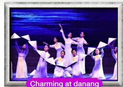
Charming at danang