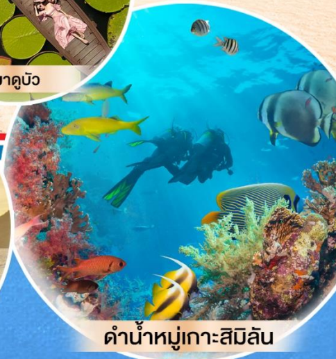
ดำน้ำหมู่เกาะสิมิลัน