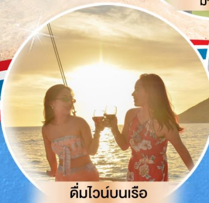
ดื่มไวน์บนเรือ