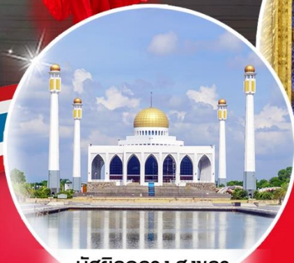
มัสยิดกลาง สงขลา