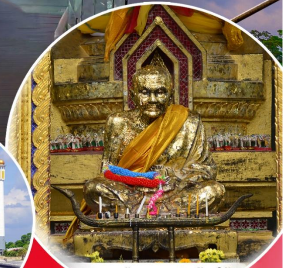
หลวงปู่ทวด ณ วัดช้างไห้