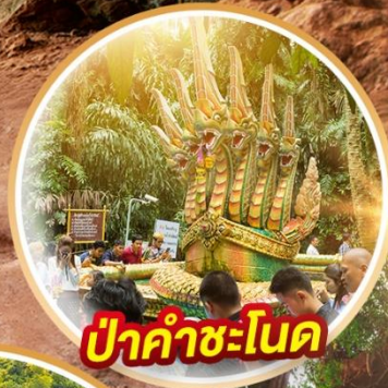
ป่าคำชะโนด

ตำนาน มนต์ขลัง แห่งพญานาค - ถ้ำนาคา @บึงกาฬ -